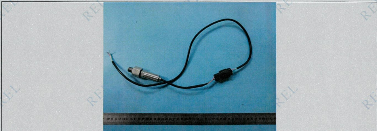
图 1 样品接收态外观代表性照片